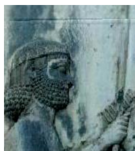
(د) روش ارائه شده در [۴]